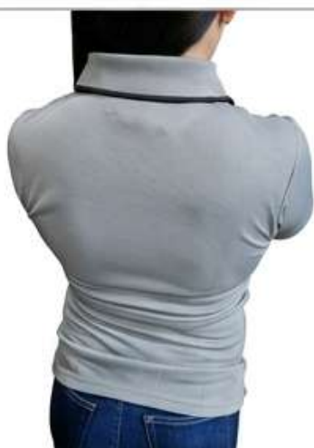
Estilo Gris (Black Trim)