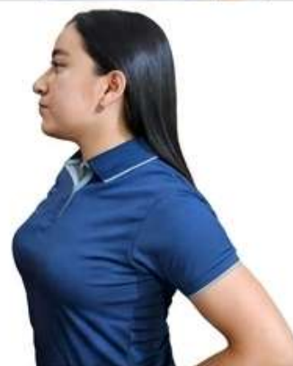
Estilo Azul (Grey Collar)