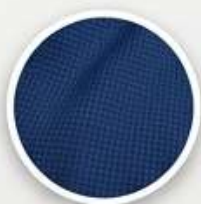
Azul Marino U-Grid