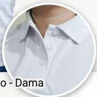
Textura Premium U-Grid