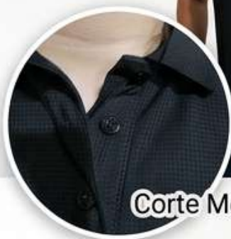
Textura Premium U-Grid & Botones Textura Premium U-Grid & Botones