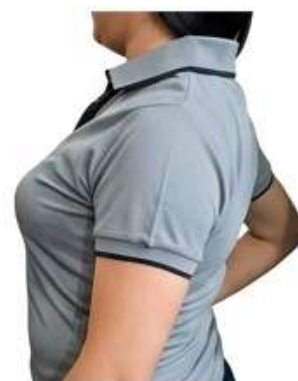
Estilo Gris (Black Trim)