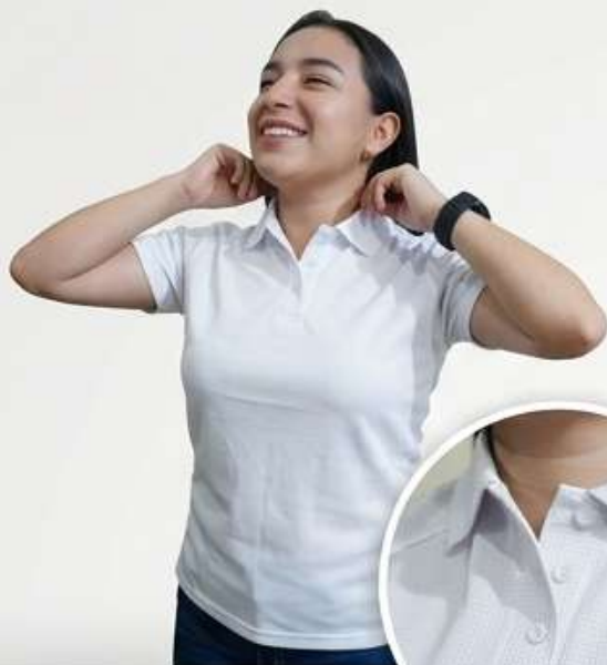
Corte Moderno - Dama

Nuestra línea U-grid combina funcionalidad y estilo ejecutivo, ofreciendo transpirabilidad superior y secado rápido para uniformes de alto desempeño. Como Distribuidores de UNICRESE, garantizamos calidad duradera.