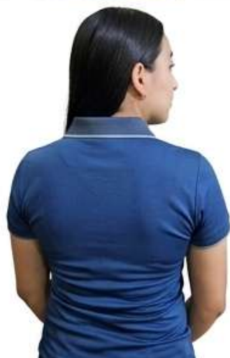
Estilo Azul (Grey Collar)