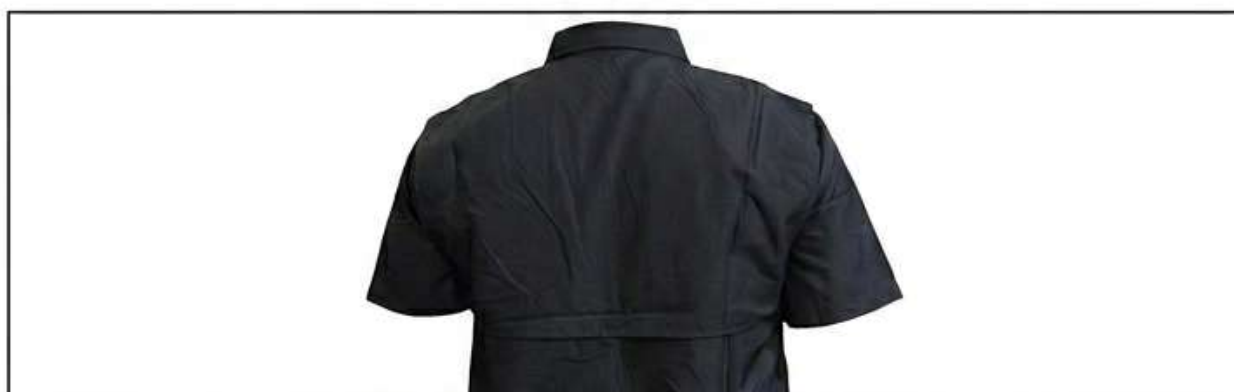
VISTA POSTERIOR (VENTILACIÓN)