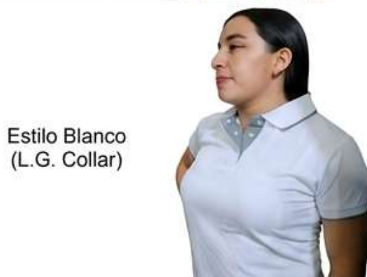
Estilo Blanco (L.G. Collar)