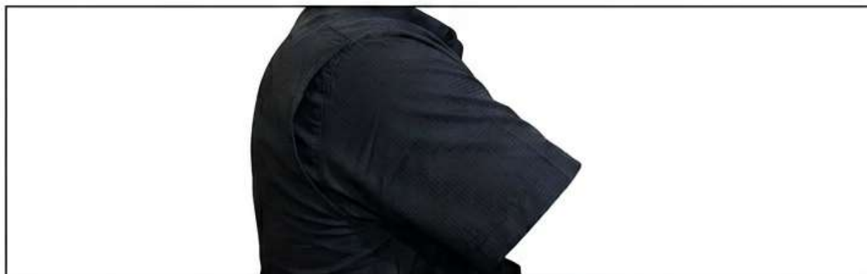
DETALLE DE TEXTURA Y MANGA

TEJIDO TRANSPIRABLE CORTE AVENTURA MÚLTIPLES BOLSILLOS SECADO RÁPIDO