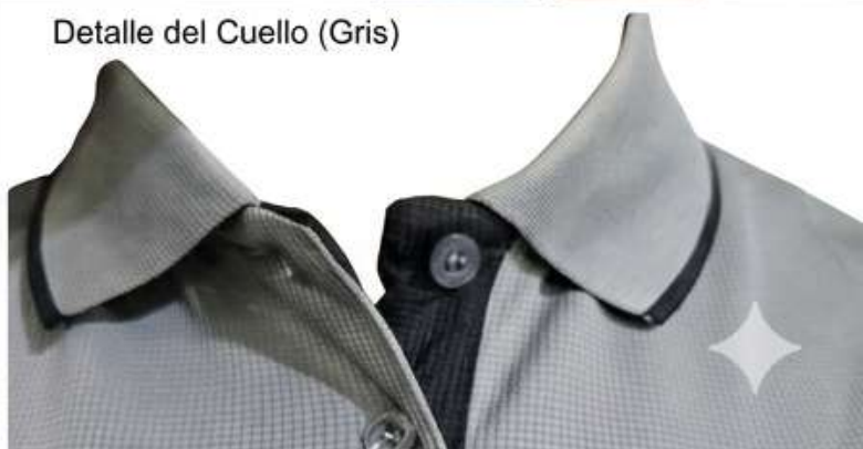
Detalle del Cuello (Gris)