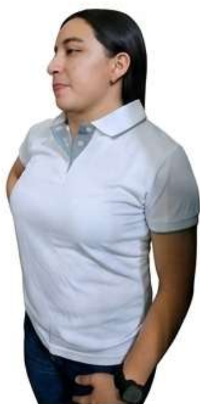
Estilo Blanco (L.G. Collar)