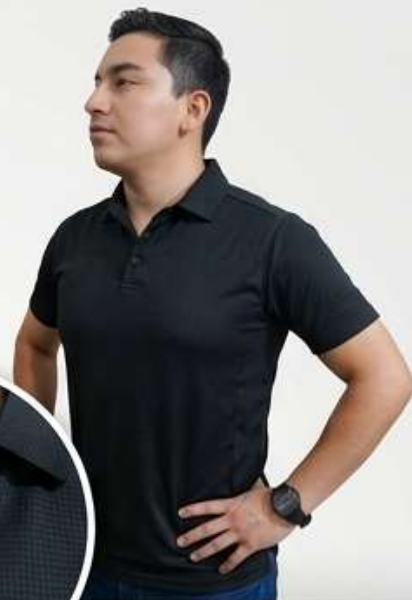
Corte Moderno - Caballero