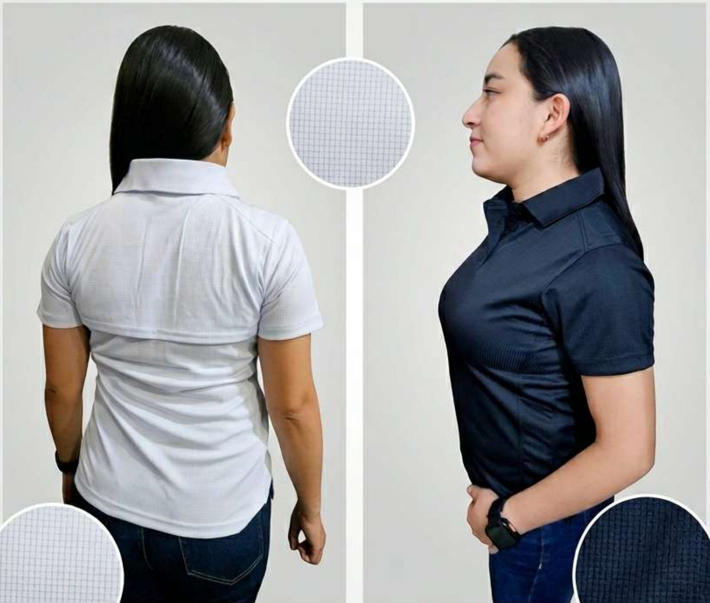
VISTA POSTERIOR (BLANCO)