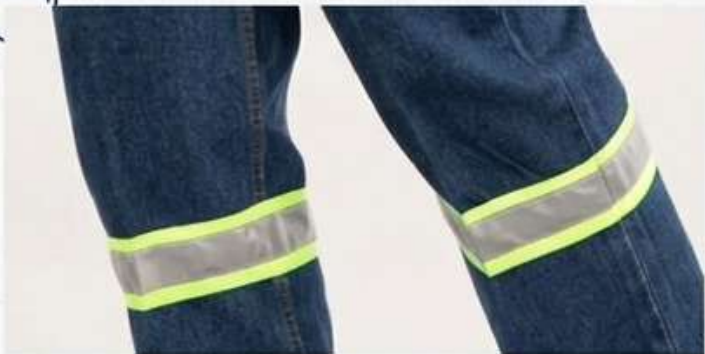
JEANS REFLECTIVE 3M COD: JEM145W00328